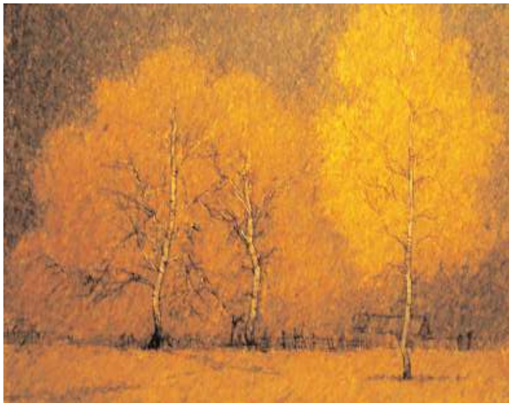
Ө. Ш. Кашаев. Көз