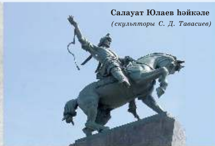
Салауат Юлаев һәйкәле (скульпторы С. Д. Тавасиев)

Урал юлы — бейек тау, Урал гүре — данлы тау — «Урал» булып калған, ти. («Урал батыр» эпосынан)