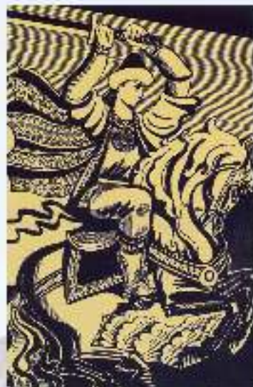
«Урал батыр» эпосы

Урал юлы — бейек тау, Урал гүре — данлы тау — «Урал» булып калған, ти. («Урал батыр» эпосынан)