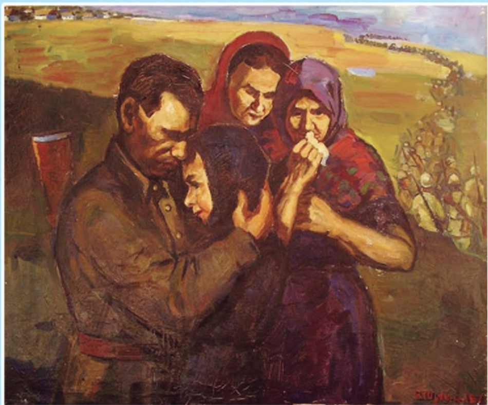
В. Шульга. «Фронтка озатыу».